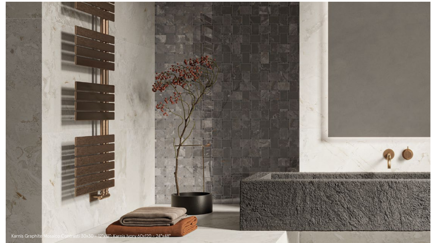
Karnis Graphite Mosaico Contrasti 30x30 - 12" x 12" - Karnis Ivory 60x120 - 24" x 48"

Per motivi tecnici i pesi sopra indicati possono variare / For technical reasons the weights indicated above may vary.