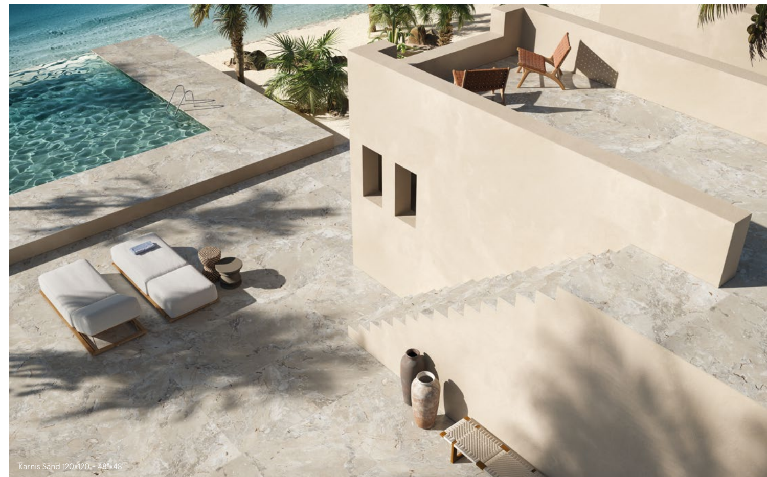
Karnis Sand 120x120 - 48" x 48"

Legenda / Legend M metri quadrati/square meters - L metri lineari/linear meters - P pezzi/pieces - S set/set